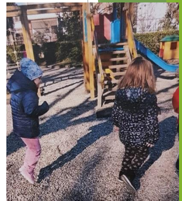
« salta con noi!!!»